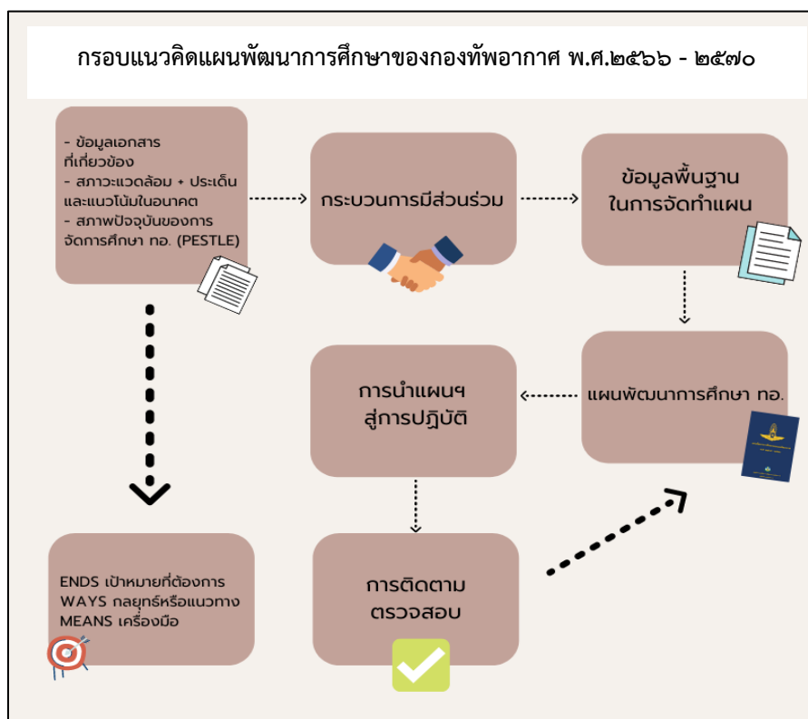
รูปภาพกรอบแนวคิดแผนพัฒนาการศึกษาของกองทัพอากาศ พ.ศ.๒๕๖๖ - ๒๕๗๐

พิจารณาจากองค์ความรู้เชิงบูรณาการในการวิเคราะห์ข้อมูลที่เกี่ยวข้องรวมทั้งการจัดทำแผนพัฒนาการศึกษาของ ทอ.และการติดตามประเมินผลการดำเนินการ