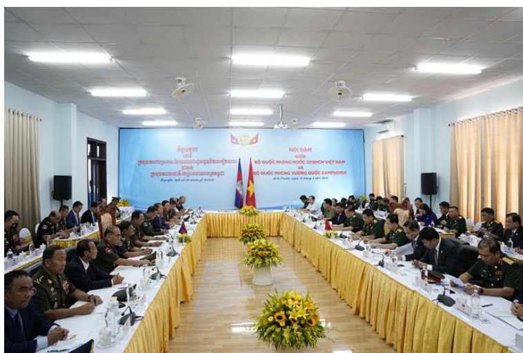
ภาพที่ ๒ กองทัพเวียดนามและกองทัพกัมพูชาประชุมหารือและทำข้อตกลงร่วมกันในการปักปันพื้นที่เขตแดนเป็นครั้งแรก วันที่ ๑๕ พฤษภาคม พ.ศ. ๒๕๖๕

เวียดนามและกัมพูชาได้ลงนามในข้อตกลงว่าด้วยแผนการจัดการและร่วมวางแผนการจัดการเกี่ยวกับเส้นทางการค้าชายแดนระหว่างสองประเทศ ดำเนินการปักปันเส้นเขตแดนให้ชัดเจน สร้างพรมแดนแห่งสันติภาพ มิตรภาพ สร้างความร่วมมือและพัฒนาร่วมกัน เพื่อตอบสนองความสามารถในการป้องกันชายแดนร่วมกันของสองประเทศ