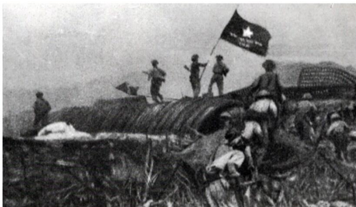
Lá cờ Quyết chiến Quyết thắng tung bay trong chiến dịch Điện Biên Phủ tháng 5 năm 1954.

ภาพที่ ๔ ธงประกาศชัยชนะในสมรภูมิตีเียนเบียนฟูในเดือน พฤษภาคม พ.ศ. ๒๔๙๗