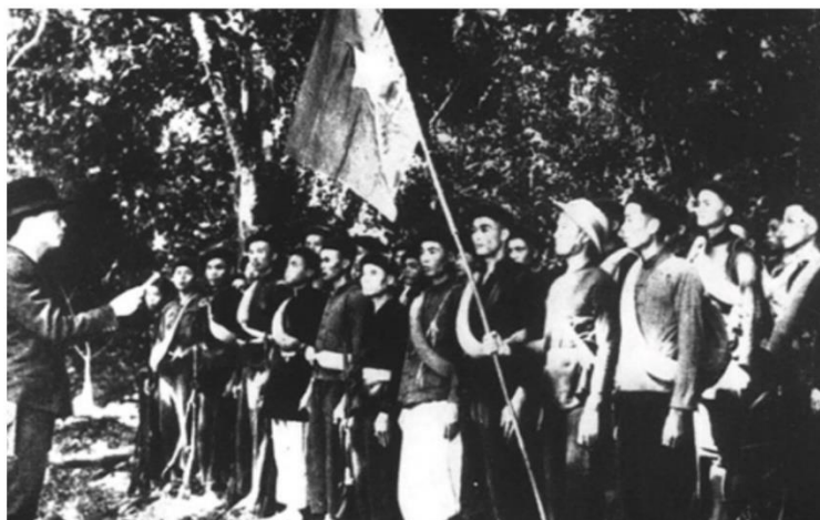
Đội Việt Nam Tuyên truyền Giải phóng quân (Tiền thân của Quân đội nhân dân Việt Nam) thành lập ngày 22/12/1944.

ในช่วงสงครามปลดแอกและประเทศ กองกำลังป้องกันทางอากาศและกองทัพอากาศเวียดนามได้แสดงแสนยานุภาพ ปฏิบัติภารกิจได้สำเร็จลุล่วง สามารถเอาชนะกองเรือและฝูงบินของสหรัฐอเมริกาทำให้สามารถปกป้องเวียดนามเหนือจากการโจมตีนับครั้งไม่ถ้วน มีบทบาทสำคัญในการคุ้มครองเส้นทางลำเลียงในการปลดแอกเวียดนามใต้ ทำให้ภารกิจการรวมประเทศประสบความสำเร็จอย่างรวดเร็ว มีกำลังพลที่ได้รับการยกย่องให้เป็นวีรบุรุษของประเทศเป็นจำนวนมาก