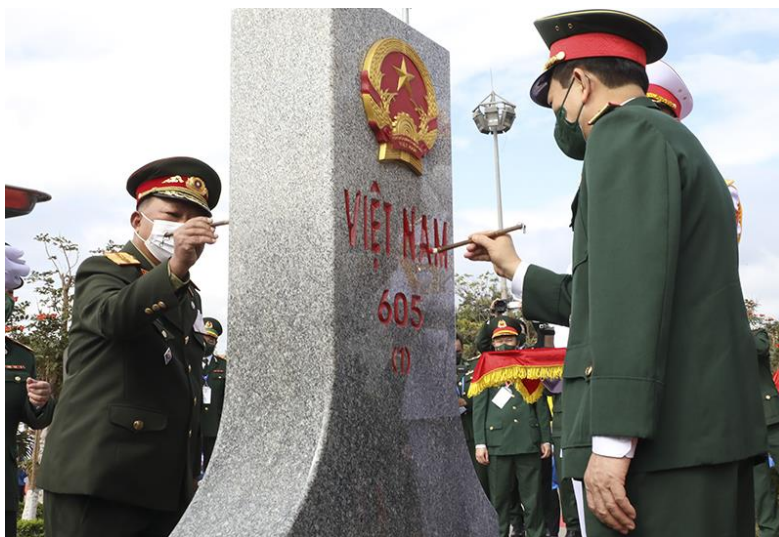
ภาพที่ ๑ กองทัพเวียดนามและกองทัพลาวประชุมหารือและทำข้อตกลงร่วมกันในการปักปัน พื้นที่เขตแดนเป็นครั้งแรก วันที่ ๑๒ ธันวาคม พ.ศ. ๒๕๖๔