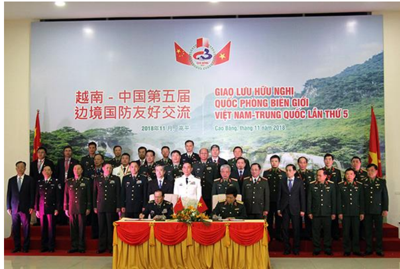
ภาพที่ ๖ การลงนามในการประชุมการป้องกันชายแดนระหว่างประเทศ จีน - เวียดนาม ในเดือน พฤศจิกายน พ.ศ. ๒๕๖๑