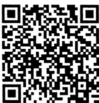
เอกสารประกอบการประชุม RM/IC ครั้งที่ ๑/๖๕