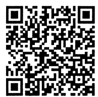
คู่มือการบริหารความเสี่ยง และควบคุมภายใน ยศ.ทอ.