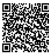
Gantt Chart RM/IC