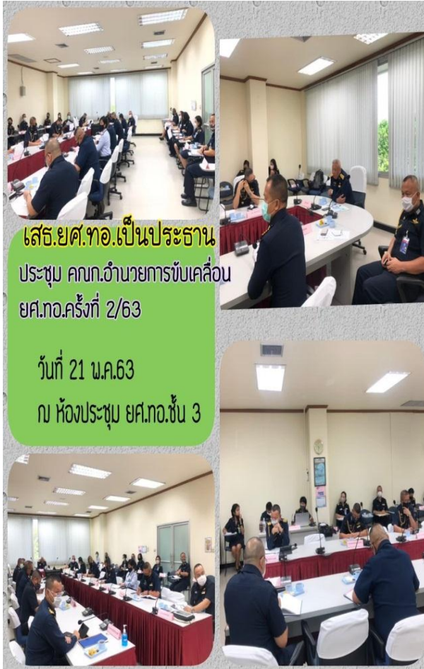
เสธ.ยศ.ทอ.เป็นประธาน ประชุม คณก.อำนวยการขับเคลื่อน ยศ.ทอ.ครั้งที่ 2/63 วันที่ 21 พ.ค.63 ณ ห้องประชุม ยศ.ทอ.ชั้น 3

รร.สธ.ทอ.ยศ.ทอ. และ รร.นป.ยศ.ทอ. กลุ่มประกวดผลงาน นำเสนอผลงานให้ประธานและ คณก.ฯ รับฟัง