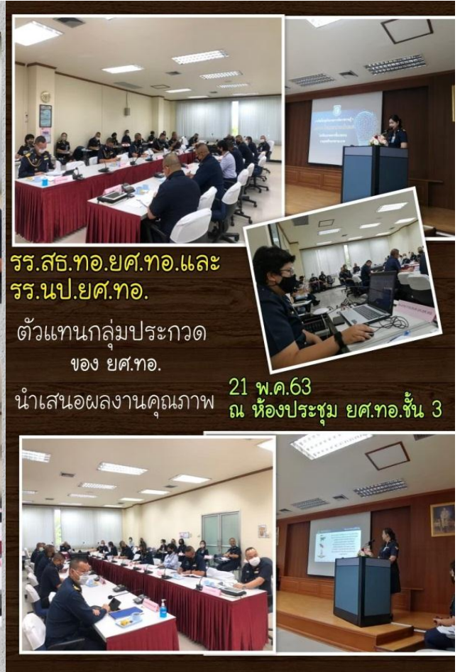
รร.สธ.ทอ.ยศ.ทอ.และ รร.นป.ยศ.ทอ. ตัวแทนกลุ่มประกวด ของ ยศ.ทอ. นำเสนอผลงานคุณภาพ 21 พ.ค.63 ณ ห้องประชุม ยศ.ทอ.ชั้น 3